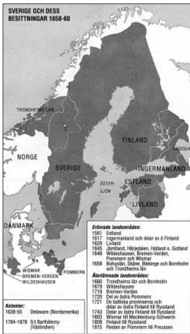
Ur Litet Lexikon över Sveriges regenter . Vincent Förlag, Boda Kyrkby.