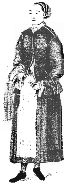
Mora Figa Sons Kulla.