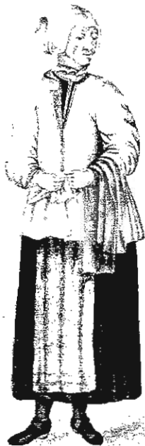
Mora Bonde hustru, en Liaring.